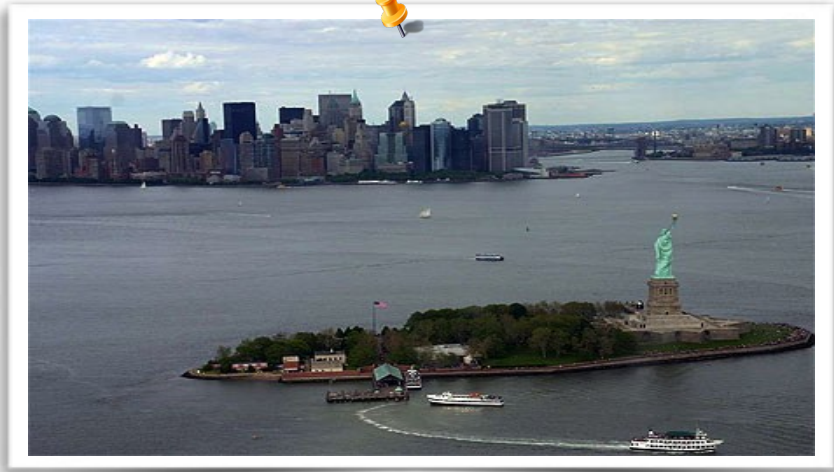
La statue de la liberté sur l'île de Liberty Island avec vue sur Manhattan (New-York)

La statue de la Liberté est une œuvre gigantesque : elle mesure 46,6m de haut (93 mètres de haut avec son socle !). C'est une grande prouesse technique. Cette statue est creuse et est constituée de fines plaques de cuivre repoussées sur une carcasse en acier. Elle a été conçue à Paris par le sculpteur Frédéric Bartholdi, en collaboration avec l'ingénieur français Gustave Eiffel qui en a exécuté la charpente.