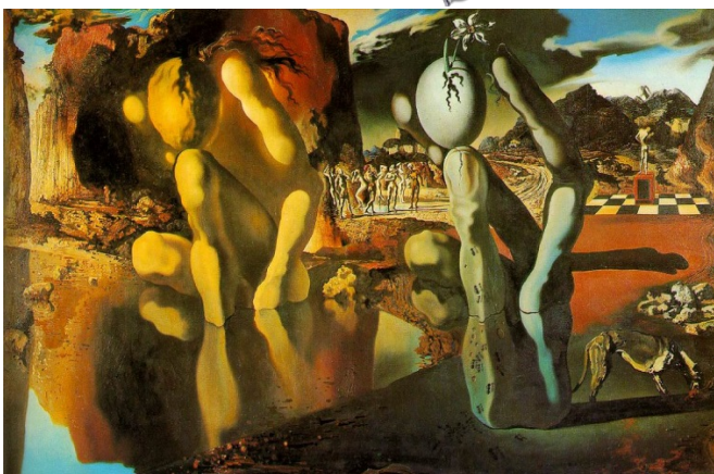
Dali - La métamorphose de Narcisse - 1937