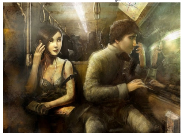
David Revoy - Narcisse et Echo - 2006