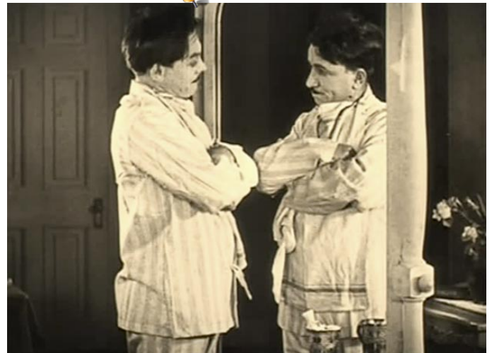
La fameuse scène du miroir