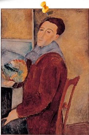
Une des inspirations picturales du Tableau : Amedeo Modigliani (ici Autoportrait, 1919).

Graphisme : Laguionie invente d'abord un contexte historique pour le personnage du Peintre, dont il situe la carrière dans les années 1920-1930, et dont il détermine les influences picturales : il s'inspire de Chagall, Matisse, Derain, Bonnard, ainsi que de Picasso et de Modigliani, dont certaines anciennes toiles du Peintre, vues dans son atelier, sont des imitations.