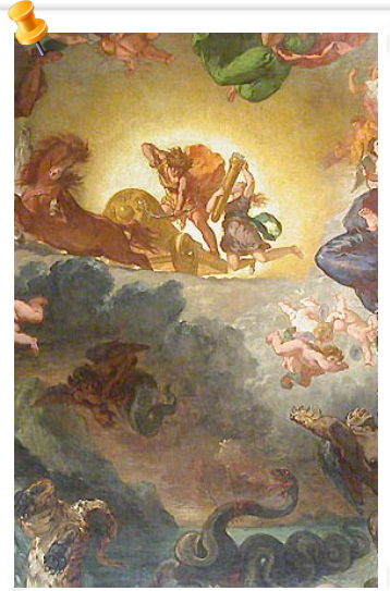
Apollon vainqueur du serpent python