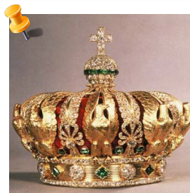
Couronne de l'Impératrice Eugénie