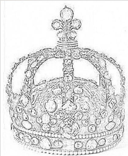
Couronne du Sacre de Louis XV