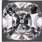
Diamant dit « le Régent »