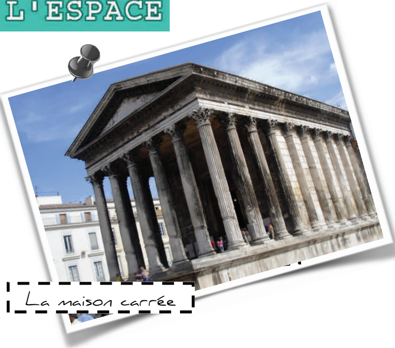
La maison carrée

Le bâtiment a été utilisé sans interruption depuis le XIème siècle. Tour à tour maison consulaire, écurie, appartement, église, première préfecture du Gard, archives départementales puis dès 1823, le premier musée de Nîmes. C'est pourquoi il est aussi bien conservé. En 2010, s'est achevée la restauration de la Maison Carrée, débutée en 2006.