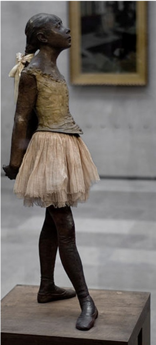
La Petite Danseuse de quatorze ans (exemplaire du musée d'Orsay, Paris)