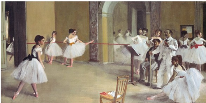
Foyer de la danse à l'opéra