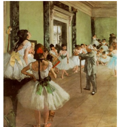
La classe de danse