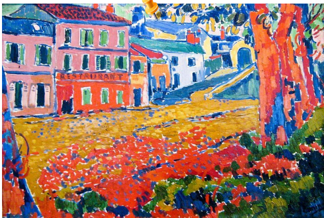
Restaurant à Bougival, 1905