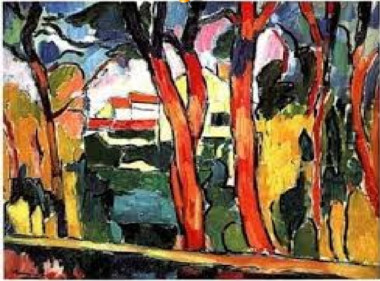
Les arbres rouges, 1906