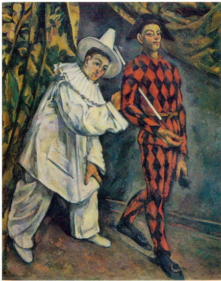
Pierrot et Harlequin, Paul Cézanne, 1888