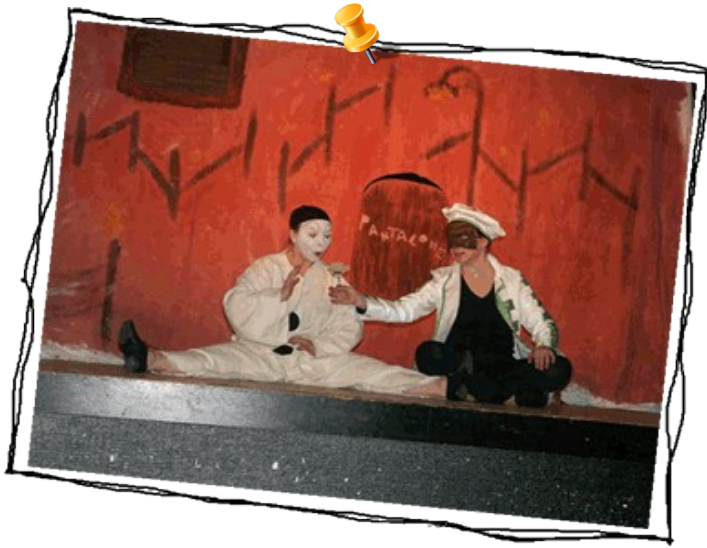
De Pierrot à Colombine, par la Cie des Sans Lacets