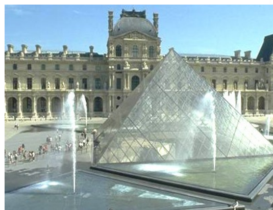
La grande pyramide du Louvre...