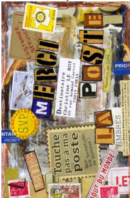
Comme autrefois l'art postal dans votre boîte à lettres, aujourd'hui le tweet art du samedi.