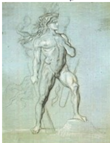
Hercule et l'hydre de Lerne, dessin, Gustave Moreau, 1869-76