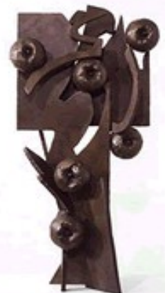
Travail d'Hercule, bronze, Norman Sunshine, 2002