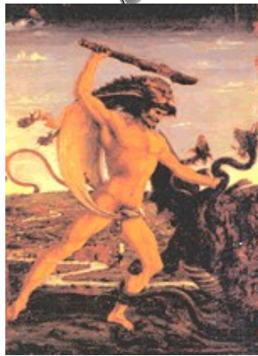
Héraclès abattant l'hydre, huile sur toile, Antonio Pollaiuolo, 1470