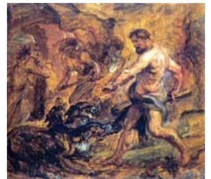
Héraclès et Cerbère, huile sur toile, Pierre Paul Rubens, 1638