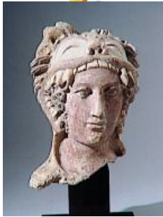
Tête d'Héraclès imberbe, terre cuite, V e -IV avJC