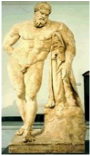
Hercule Farnèse, marbre, Glycon, III e siècle avJC