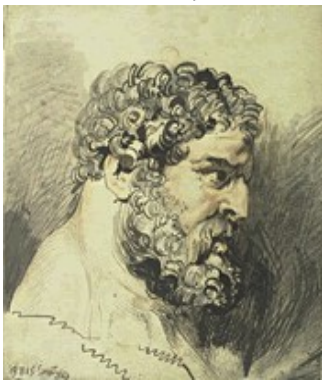
Profil d'Hercule, dessin, Pierre Paul Rubens, XVII e siècle

De l'obscur potier grec de la période classique aux artistes contemporains, en passant par les peintres de la Renaissance et les sculpteurs baroques, tous ont tenté, selon leur inspiration et leur sensibilité, de saisir et d'immortaliser l'un des héros les plus célèbres de l'humanité.