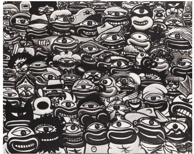
Black Hero, 2013