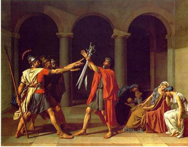
Jacques-Louis David, Le serment des Horaces, 1785, huile sur toile