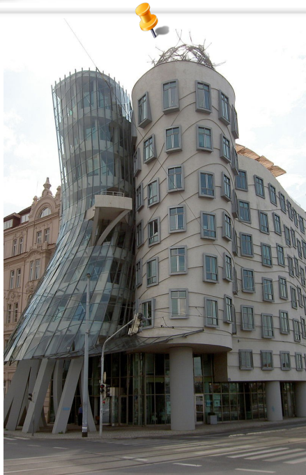
Maison dansante à Prague

Frank Owen Gehry, né le 28 février 1929 à Toronto, est un architecte américano-canadien. Professeur d'architecture à l'Université Yale, il est considéré au début du xxie siècle comme un des plus importants architectes vivants. Ses constructions sont généralement remarquées pour leur aspect original et « tordu »