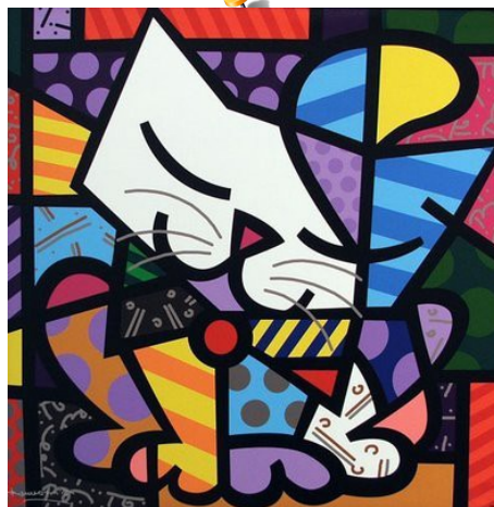
Le chat, 1998