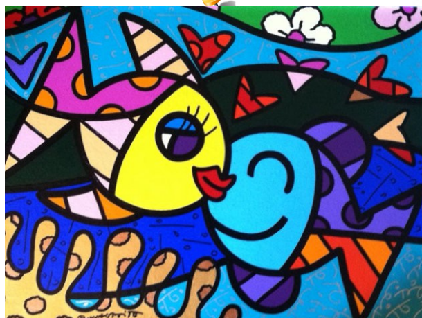
Deux poissons, 2011

Il a réalisé sa première exposition à 14 ans. Dans sa jeunesse, il a visité de nombreux pays d'Europe. Établi à Miami, il a installé son atelier dans le quartier de Coconut Grove, où il expose ses œuvres dans les rues.