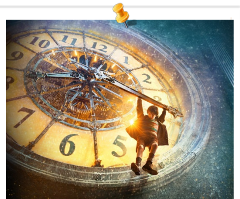
Hugo Cabret (2011) film de Martin Scorsese