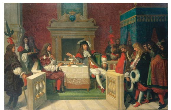
Esquisse « Louis XIV et Molière déjeunant à Versailles » par Ingres