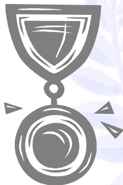
MEDAILLE DE BRONZE