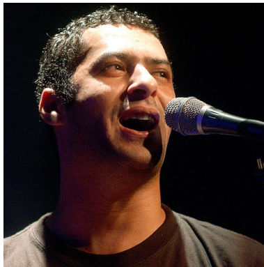
Georges Brassens... en 1970