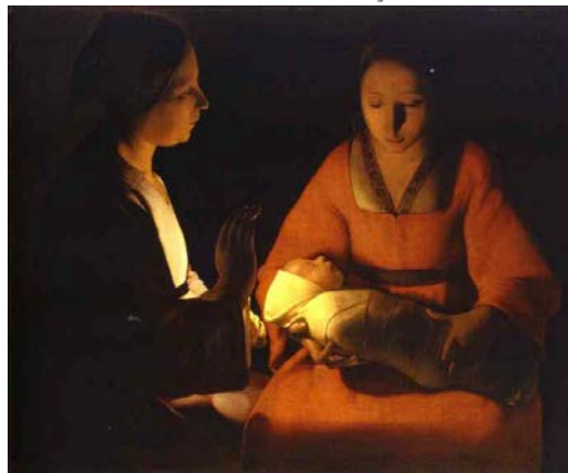
Le Nouveau-Né (vers 1648)