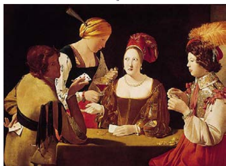
Le Tricheur à l'as de carreau (vers 1635)