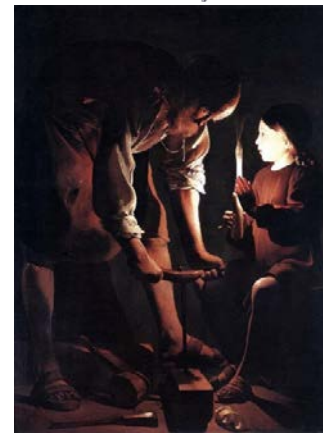
Saint Joseph charpentier (vers 1640)