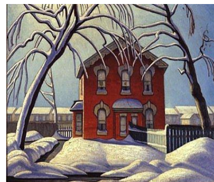
La maison rouge - 1925