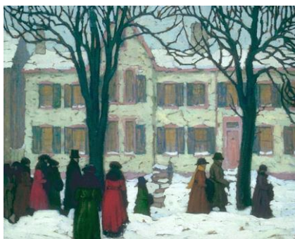
Le retour de l'église - 1919