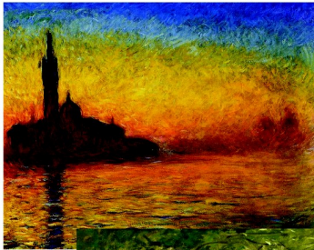
Autres tableaux de Claude Monet