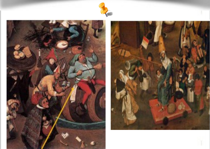
Le roi Carnaval

Au Moyen Age, les fêtes populaires comme le Carnaval sont liées à la religion. Le Carnaval durait 3 jours, avant le Carême (période de « jeûne » avant Pâques), Les gens se déguisaient et portaient des masques, de déplaçaient en cortège dans les rues en chantant, dansant et en faisant des farces. Pendant le Carnaval, on s'amuse et on s'arrête pour un spectacle de cracheur de feu, une scène comique... On mange de la viande et du « gras » (beignet, gaufres) et des douceurs, qui seront interdit pendant le Carême,