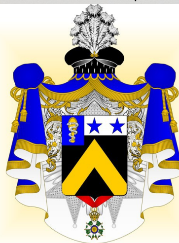
Armes du comte de Boissy d'Anglas et de l'Empire