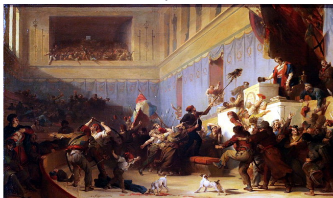
Alexandre-Evariste Fragonard Boissy d'Anglas sauvant la tête du député Féraud