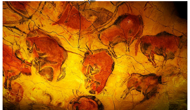
Grotte Altamira (Espagne)