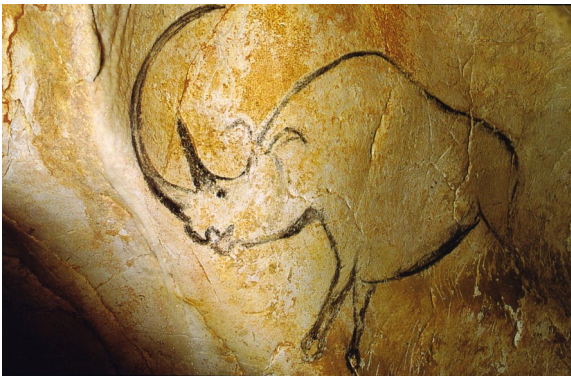
Grotte Chauvet (France)

Les parois pouvaient être raclées avec de larges pierres avant d'être peintes. Ils pouvaient peindre avec des pinceaux de crin ou de fourrure animale et utilisaient le charbon, les différentes couleurs de terre et les des pierres pour ses couleurs. Il sculptait ou gravait la pierre aussi.