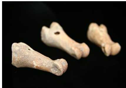
Sifflets - Phalanges perforées Grotte d'Aurignac