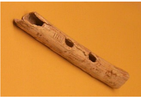
Flûte en os (Grottes d'Isturitz)

Le rhombe est une pièce d'os ou de bois ovoïde allongée qui présente un trou à l'une de ses extrémités. Cet orifice permet de passer un lien. Pour l'utiliser (en se basant sur les pratiques actuelles), on fait tourner l'objet comme une fronde au bout d'une corde. Il s'en dégage un sifflement (ou vrombissement) assez mélodieux.