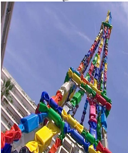
Exposition Cannes 2016, Croisette, France